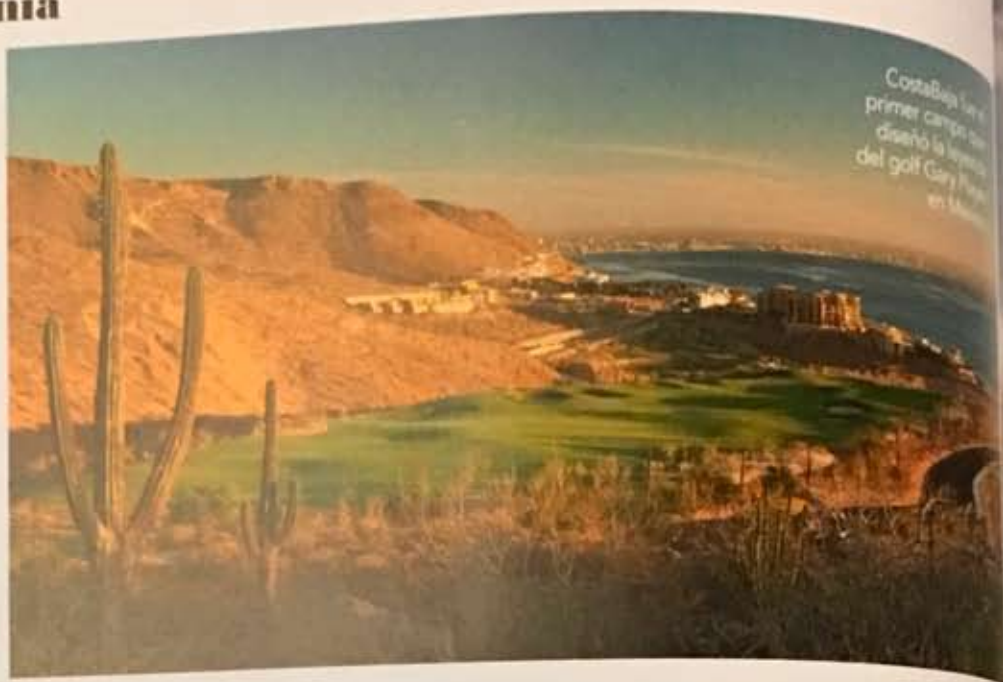
CostaBaja fue el primer campo de golf diseñado por el legendario arquitecto del golf Gary Player en México.

Este campo es amigable con los que empiezan a incursionar en el