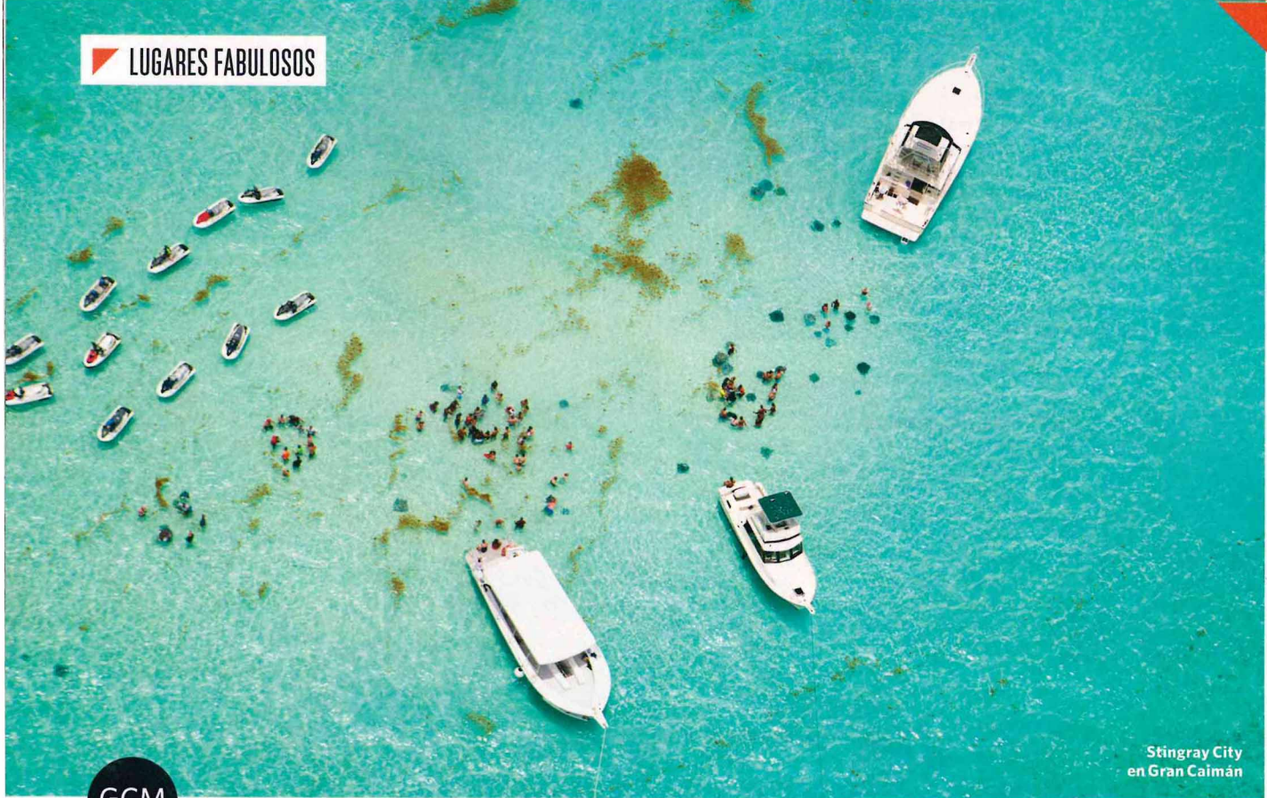
Stingray City en Gran Caimán